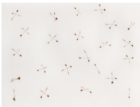
Sporenkapseln eines Moooses